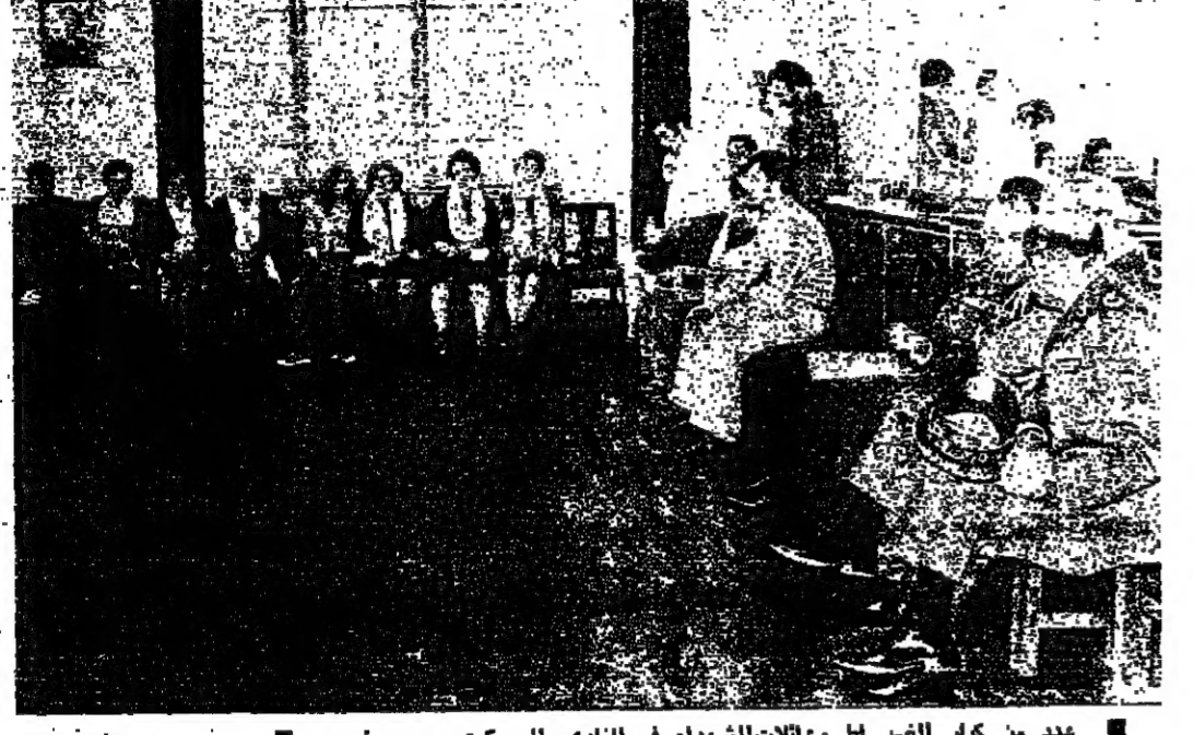
عدد من كبار الضباط وعائلات الشهداء في النادي العسكري بيروت امس

كتب نزيه نقوزي : استشهد ضباط لبنانيين ، و ١٤ من الجنود ، وجرح ٤٢ آخرون ، في الاعتداءات الاسرائيلية على ثكنة صور ومخيمات البص والبرغلية وبرج رحال امس . وقد عبرت تقابل العدو ، من البر والبحر والجو ، عشرات المساريل والاكواخ في مخيم البرغلية .. وعلى كل اعتداء كان الرد عنيفاً ، من قسبل الجيش والقواتية ، وتكبيل العدو خسائر في الارواح ، والامتداهات حصلت على مرحلتين ، الاولى بدأت في الواحدة والنقبة ٥٠ نجر امس ، عندما شلقت قسوة « كومنوس » للعدو ، قدرت بـ ٢٠٠ جندي الى شاطئ البص ، وانظمت من مركز مصلحة كبرياء لبنان عد مدخل المخيم الغربي مركزاً لنا .